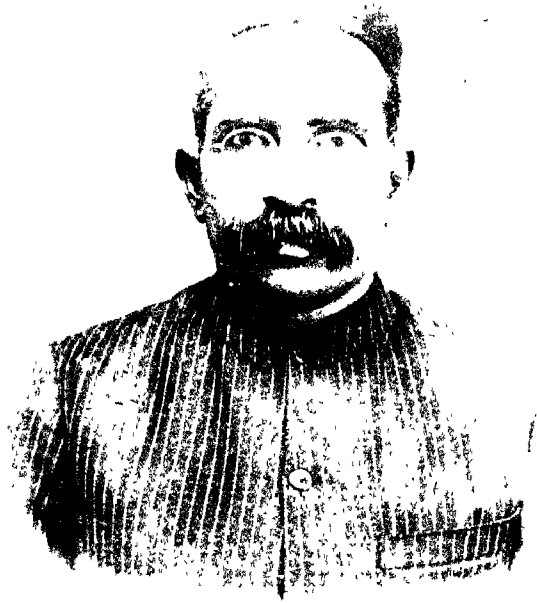
पण्डित महावीरप्रसाद द्विवेदी.